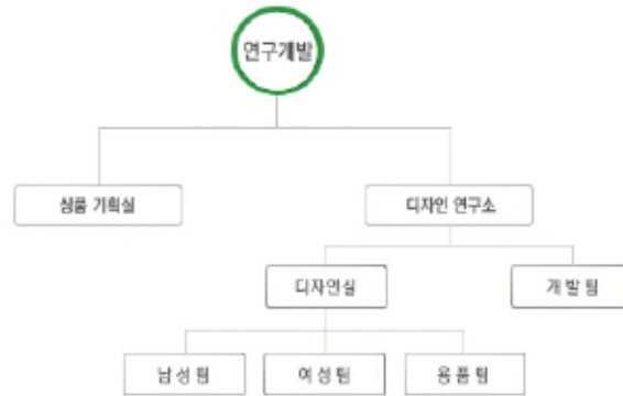
(주)보그인터내셔널 연구개발 조직도